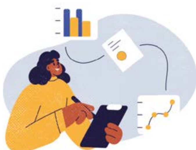
Tabela Progressiva Compensável:

O benefício de aposentadoria será tributado de acordo com a opção do Participante, conforme as Leis 11.053/2004 e 11.196/2005 (tabela progressiva compensável ou tabela regressiva definitiva) e pela lei 14.803/2024.